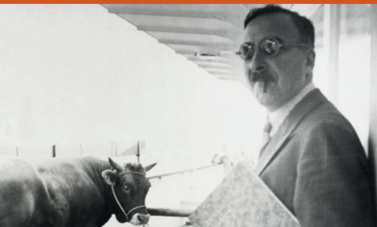
Stefan Zweig auf der Fahrt von Brasilien nach Argentinien, August 1936