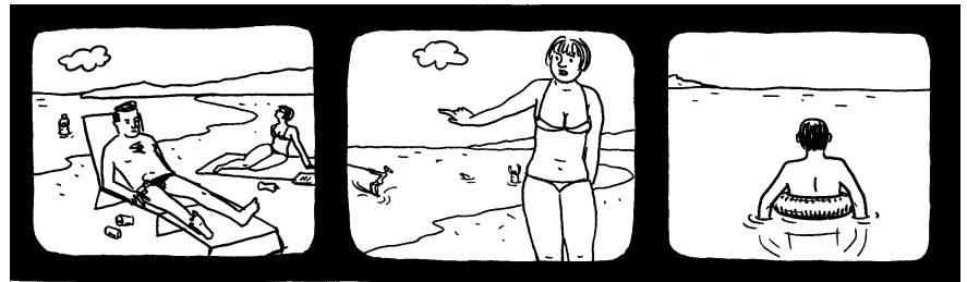
Rimini. Bikinipflicht. Sissi im Minibikini. Willi im Slip. Willi wirkt nicht wirklich schwimmwillig, richtig grimmig wirkt Willi. Ich will nicht wirklich : spricht Willis Mimik.