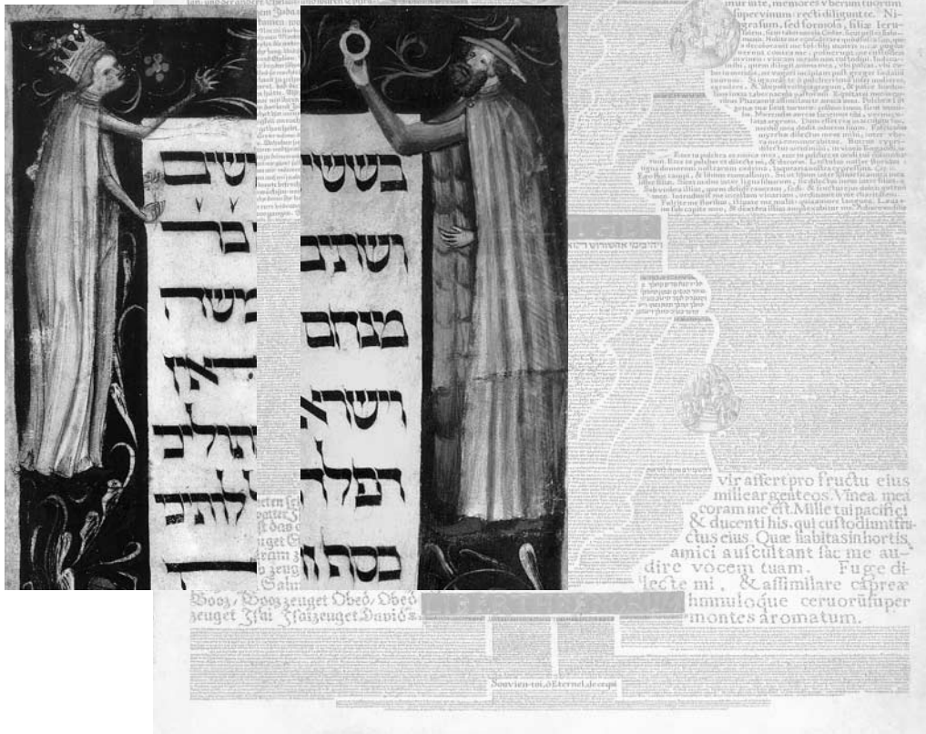
Fünf Bücher der Heiligen Schrift. Cod. Ser. n. 1594. Wien 1748.