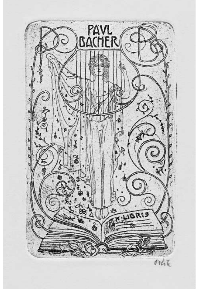
Emil Orlik: Ex Libris Paul Bacher, 1905. Ätzgrund-Radierung, 100 x 63 mm